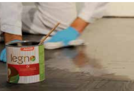
OPAKOVÁNÍ POSTUPU POMOCÍ LEGNO-ÖL NEBO LEGNO-HARTWACHSÖL