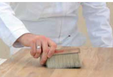
ZBAVIT PRACHU A NEČISTOT