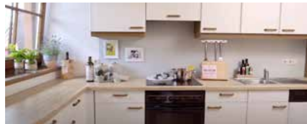
Kuchyně | Lamino