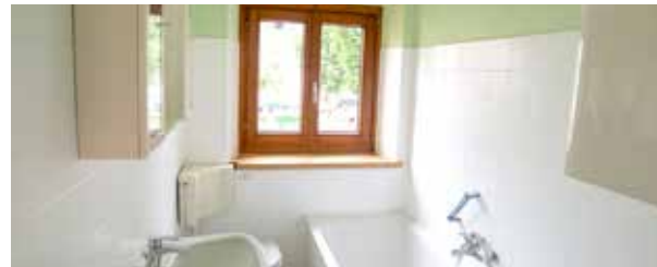
Obklady | Keramika