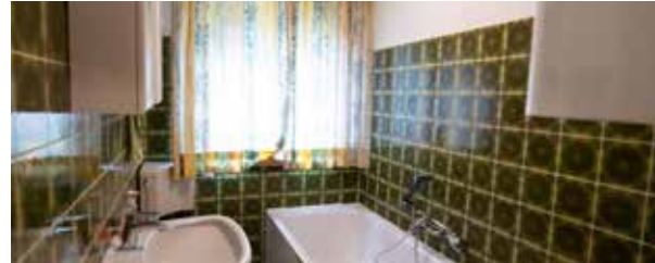
Obklady | Keramika