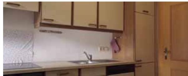
Kuchyně | Lamino